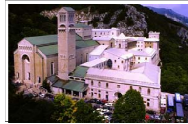
Vista dall'alto del Santuario di Montevergine

città di Avellino, capoluogo di provincia. L'origine ufficiale del santuario di Montevergine risale alla consacrazione della prima chiesa nel lontano 1126. Fu fondato da s. Guglielmo da Vercelli, il quale si ritirò sul monte (detto vergine), con lo scopo di vivere con Dio. Eresse sul monte una chiesa in onore della Madre di Dio e diede vita ad una nuova famiglia religiosa. Dopo aver seminato di sue case quasi tutta l'Italia meridionale, chiuse la sua vita nel Monastero di S. Salvatore del Goletto, in territorio di S. Angelo dei Lombardi, nell'anno 1142. I suoi resti mortali ritornano a Montevergine ai primi di settembre del 1807 e riposano nella Cripta della nuova Chiesa dedicata al suo nome.