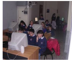
La redazione al lavoro