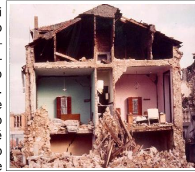
Il terremoto dell'80 distrusse gran parte del territorio.