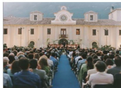
Il suggestivo cortile dell'Abbazia di Loreto

Quest'anno, nello splendido scenario dell'Abbazia, saranno ben otto i concerti che si terranno. Questa del 2007 è un'edizione particolarmente importante di Musica in Irpinia anche perché coincide con il ventiquennale della rassegna e rientra nei 37 Grandi Eventi 2007 della Regione Campania. Le migliaia di visitatori che arriveranno per assistere ai concerti potranno vedere sul palco il Maestro Salvatore Accardo, il violinista Luis Bacalov, la cantante