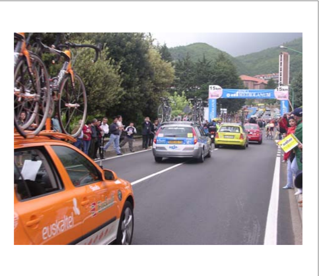
L'arrivo della "carovana rosa" a Mercogliano