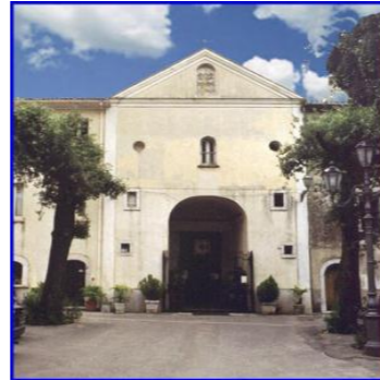
La Chiesa di San Modestino

Fuori dal centro storico di Mercogliano, in fondo al Viale omonimo, sorge la Chiesa di S. Modestino. Fu fondata probabilmente nel 1052. Dopo quella di S. Pietro era la chiesa più importante di Mercogliano. Situata nella contrada Urbiano, si unì nel 1163 con la Chiesa di S. Margherita. Probabilmente, però, la chiesa di S. Modestino fu ricostruita in posizione diversa rispetto alla prima. Bellissima e finemente arredata di marmi, fu restaurata durante il Settecento e nel 1846.