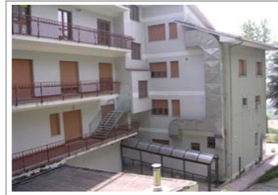
L'ex Ipai. Sede del Polo Oncologico

Dopo anni di attesa, presso l'ex Ipai di Mercogliano entrerà presto in funzione il Crom (Centro di ricerca oncologica di Mercogliano). L'apertura è stata rinviata per