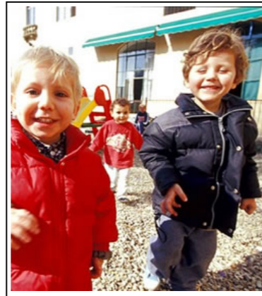
Le famiglie moderne sono poco presenti nella crescita dei bambini